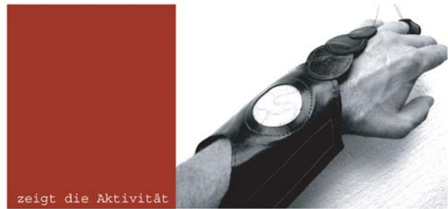
zeigt die Aktivität