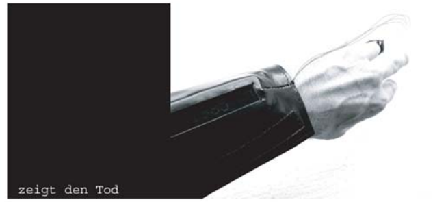
zeigt den Tod