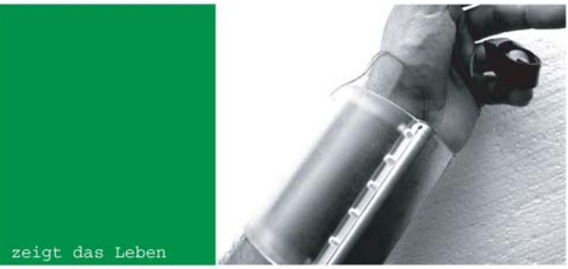
zeigt das Leben