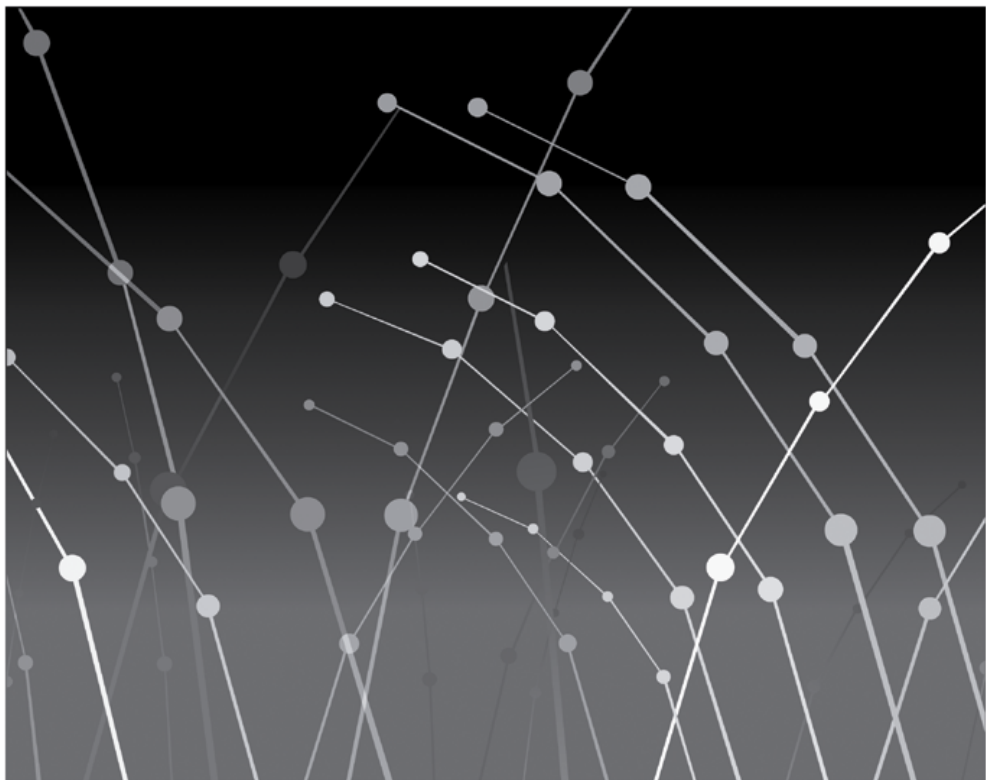
ABBILDUNG 5: Holger Lippmann: Minimal Garden, Animation, (HiRes), 2003