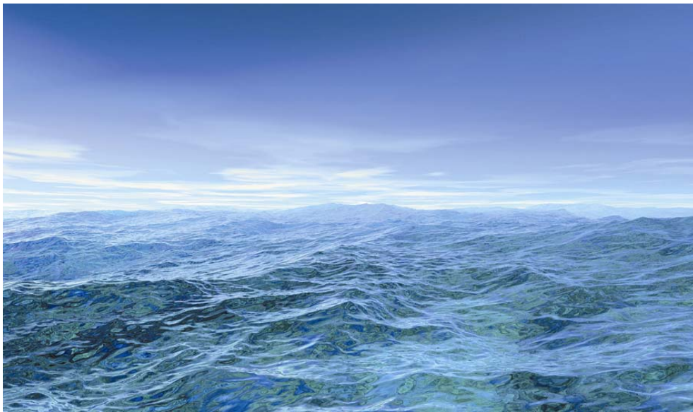
ABBILDUNG 3: Gerhard Mantz: Ertrinken Nr. 105, Tinte auf Leinwand, 100 x 170 cm