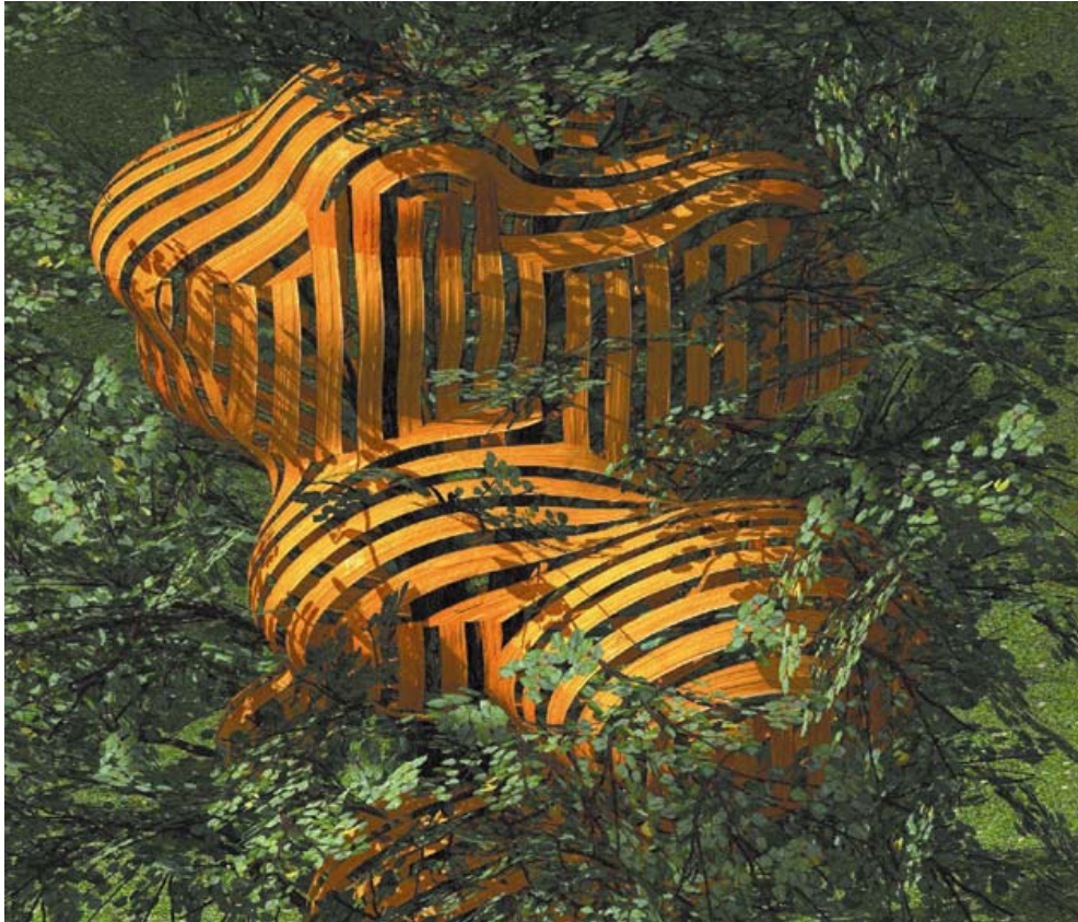
ABBILDUNG 4: Stefan Fahrnländer: Baumhaus_07, Inkjet auf Papier, (HiRes), 2003